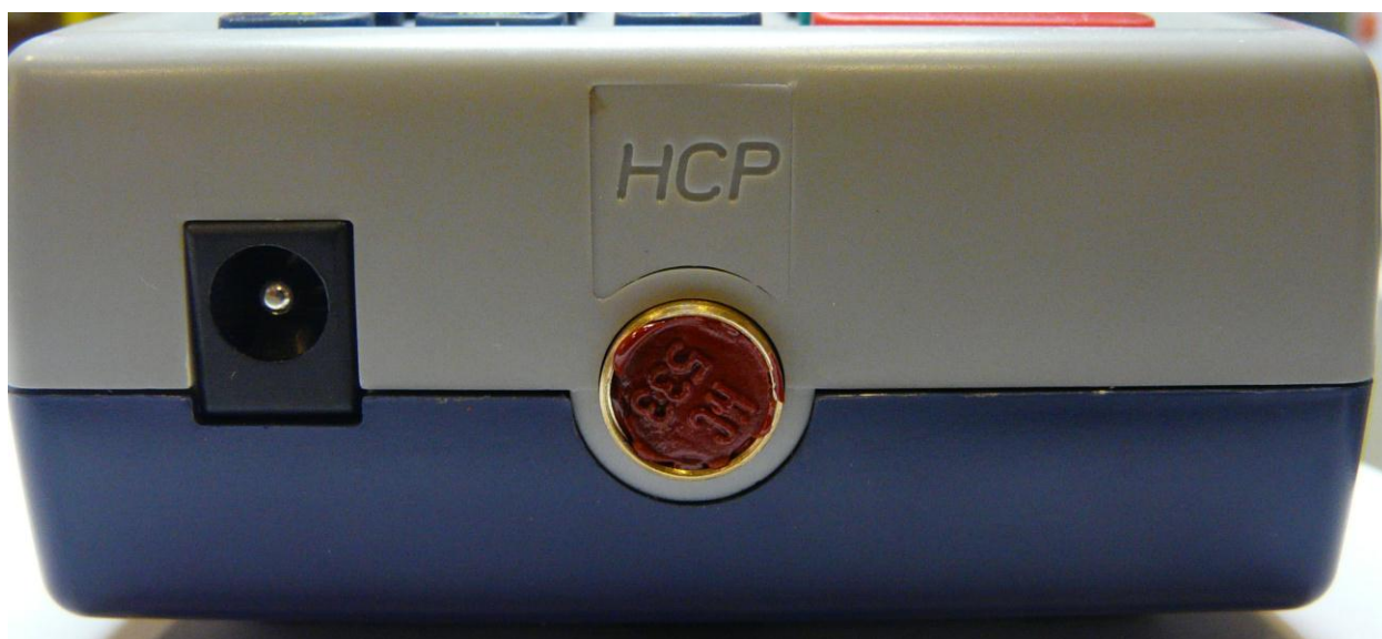
Slika 3 – Servisna plomba