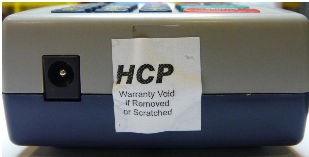
Slika 2 – Proizvođačka plomba