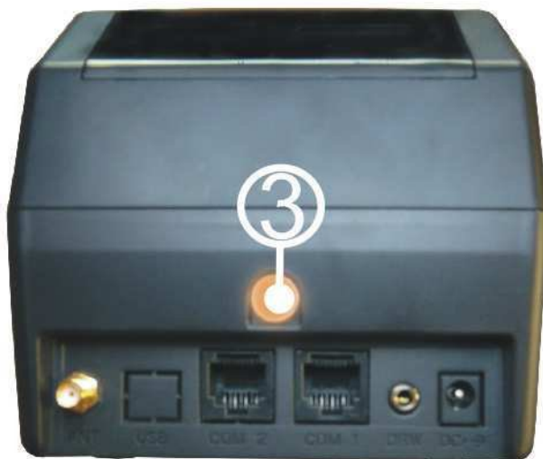
Slika 17. Mesto za servisnu plombu