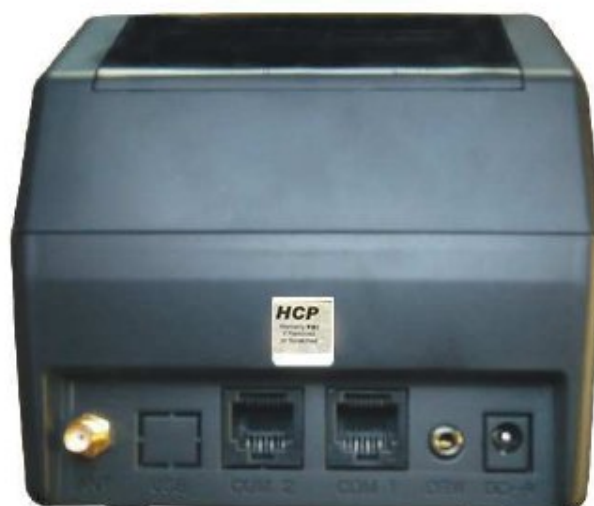
Slika 18. Mesto za proizvođačku plombu